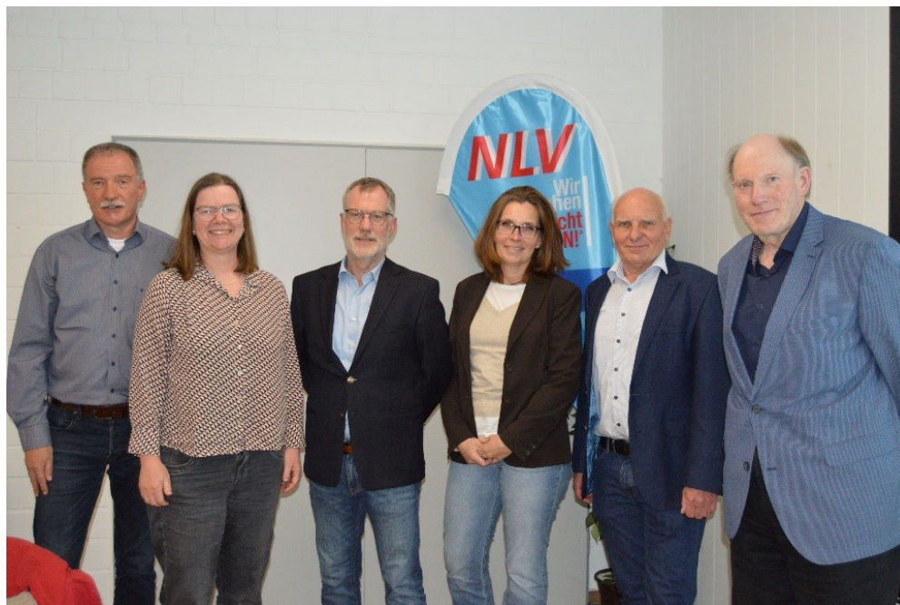
Der neu gewählte Vorstand beim „Kreisverbandstag“ am 24. April 2025 in Wunstorf

Im Rahmen des Kreisverbandstags im April 2025 wurde eine vom Landesverband initiierte Strukturreform beschlossen. Künftig übernimmt ein geschäftsführender Vorstand, unterstützt durch spezialisierte Fachressorts, die Leitung der Leichtathletik in unserem Kreisverband. Ziel dieser Maßnahme ist es, ehrenamtliche Strukturen effizienter zu gestalten und Aufgaben gezielt zu verteilen, um dem Verband eine zukunftsfähige Organisation zu gewährleisten sowie dem Rückgang an ehrenamtlichem Engagement entgegenzuwirken.