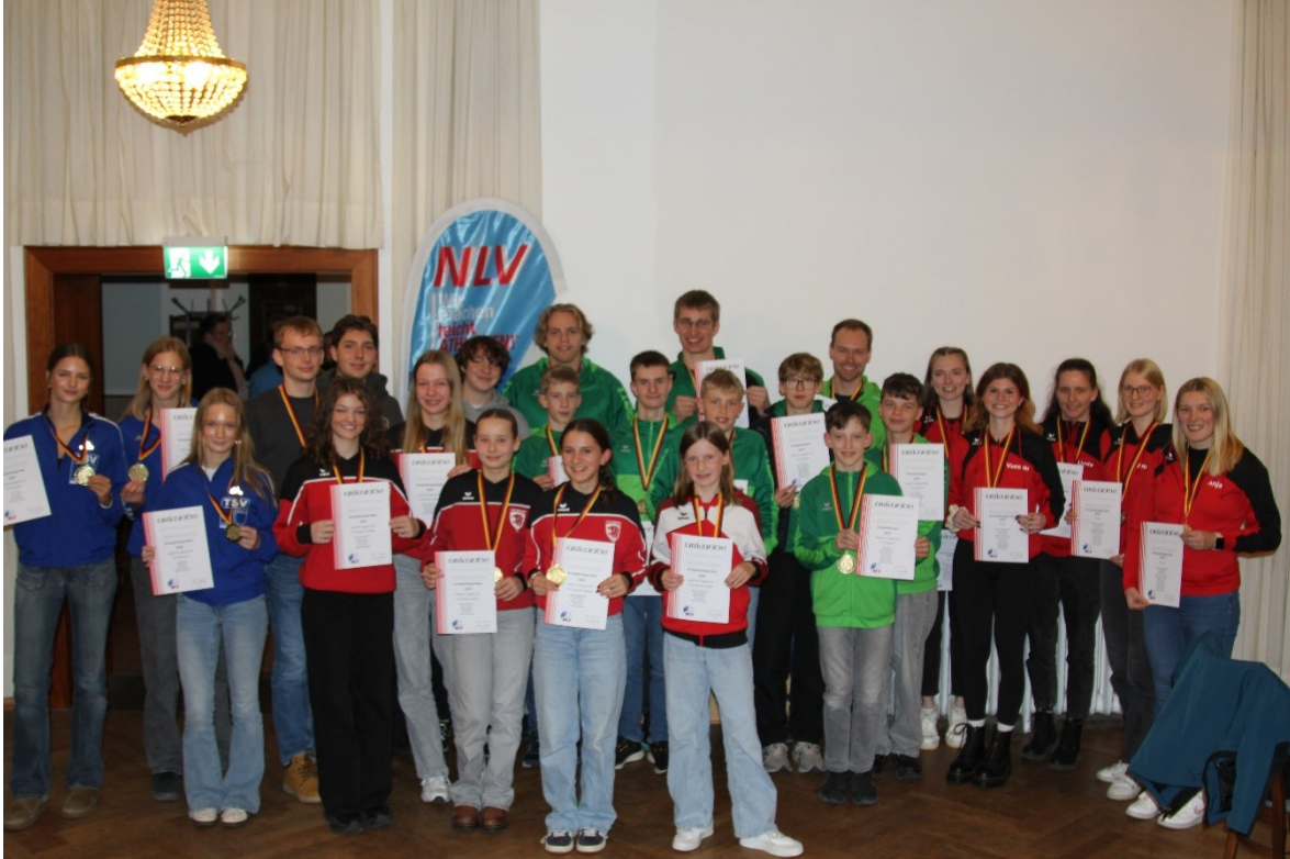
Ehrungen Kreispokalsieger 2025 bei der Arbeitstagung am 19.11.2025

Erfreulicherweise konnten nahezu alle Siegermannschaften ihre Urkunde und Medaille entgegennehmen.